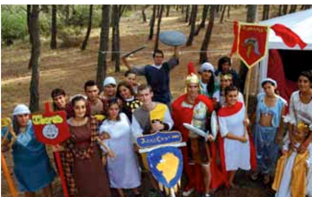
> El equipo de monitores.

Cofinanciadores: Ayuntamiento de Sagunto.