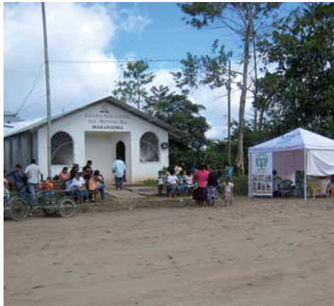
> Sede y carpa informativa de ADRA.