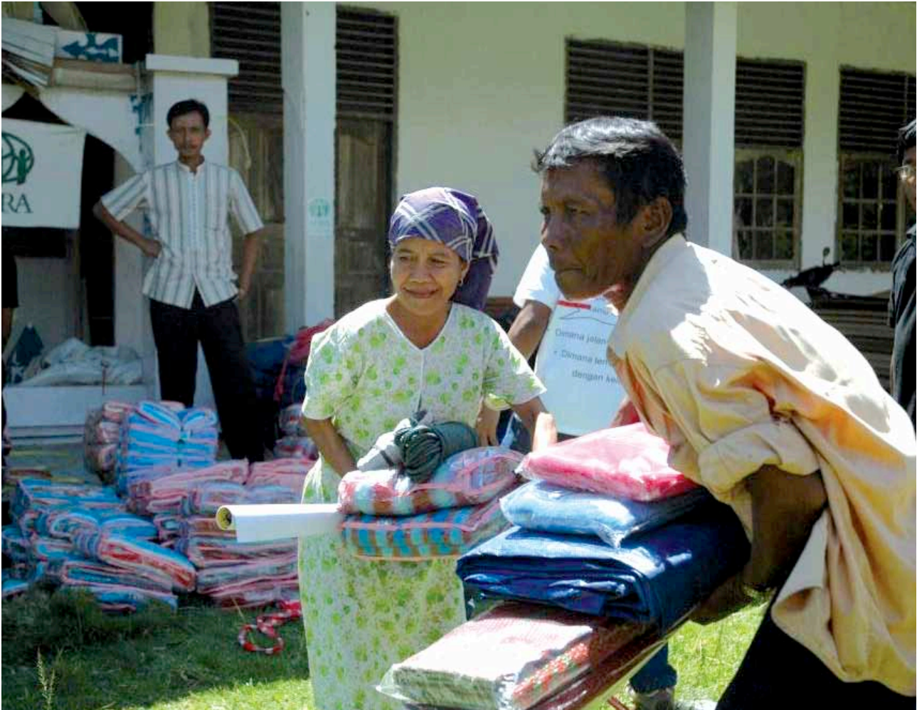
> Kit de refugio tras el terremoto de Indonesia.