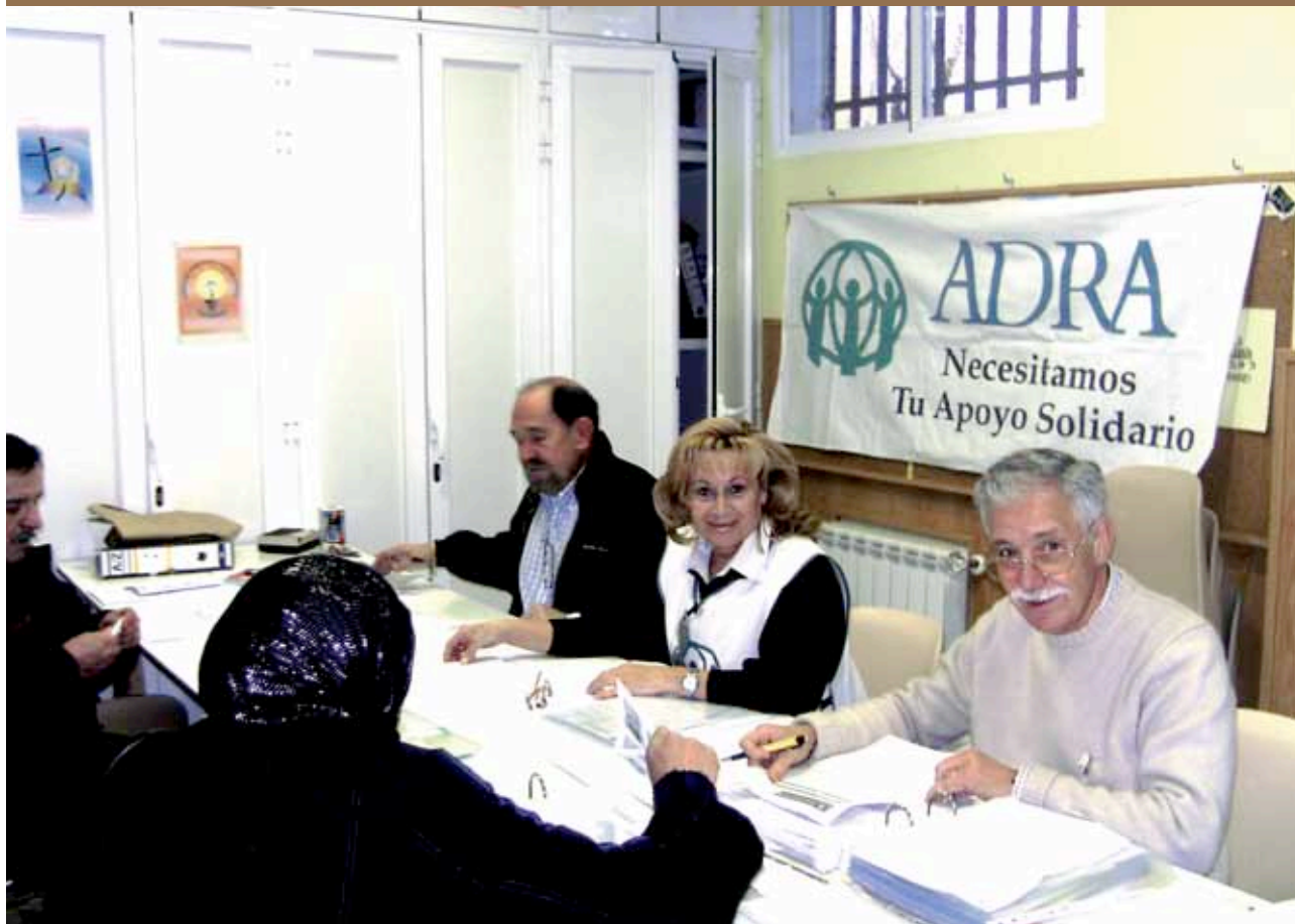
> Voluntarios atendiendo en Madrid.

Cada una de estas delegaciones se organiza mediante un consejo local, compuesto por los siguientes responsables: Delegado, Coordinador, Secretario-Tesorero, Representante de los Socios y Representante de los Voluntarios.