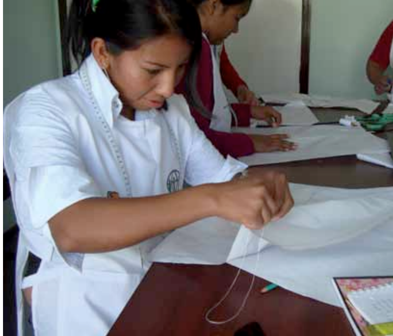
> Curso de corte y confección.