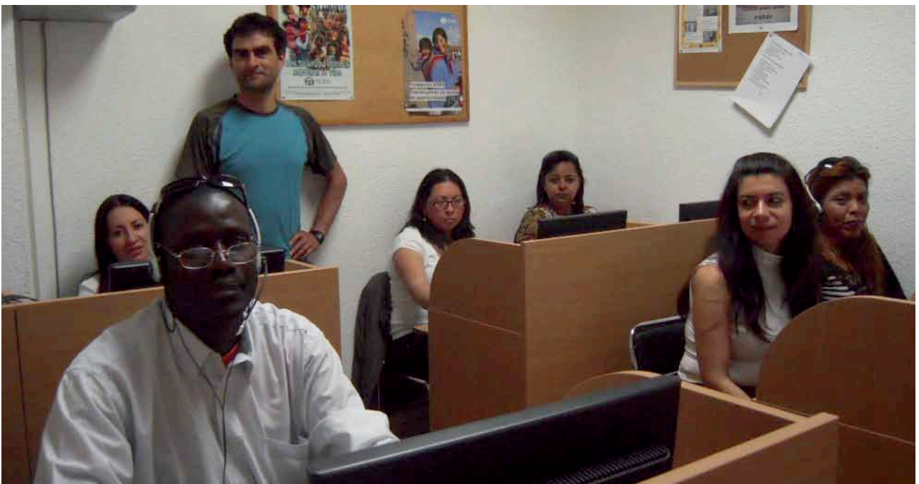
> Alumnos de curso de informática en Zaragoza.