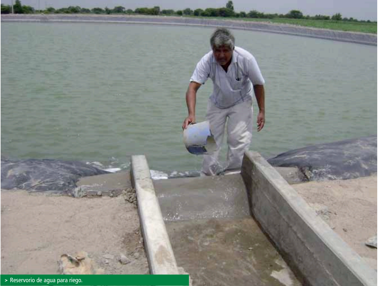
> Reservorio de agua para riego.