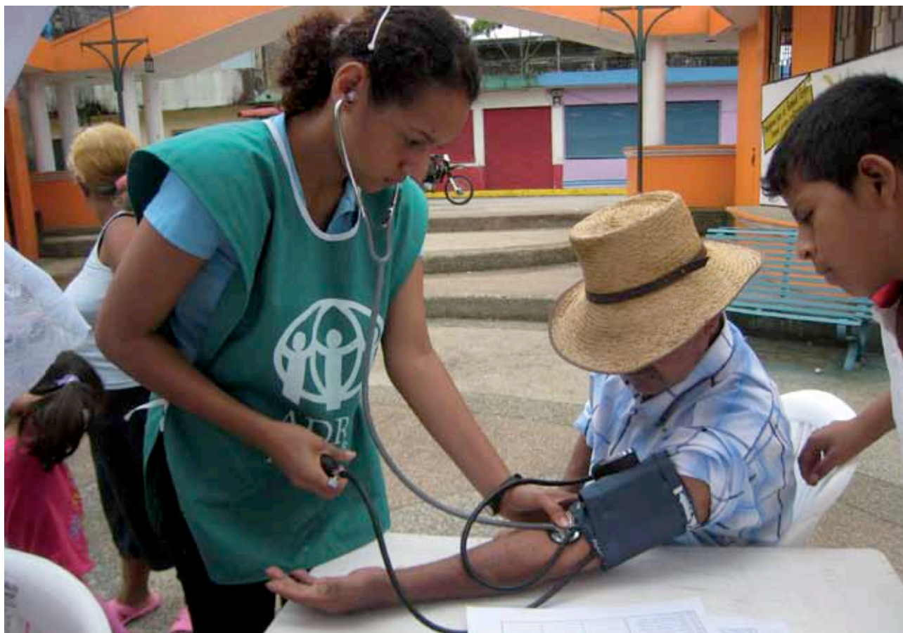
> Atención médica primaria.