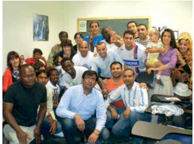
> Alumnos de curso de castellano en Vitoria.