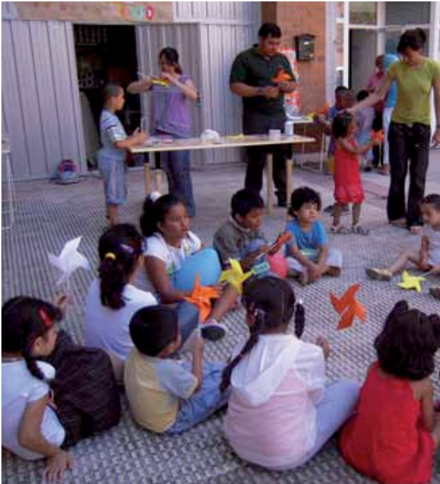
> Niños haciendo un taller.