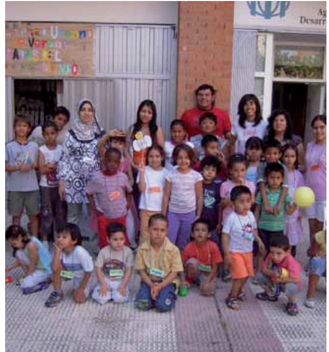
> Participantes del Campamento. Zaragoza.