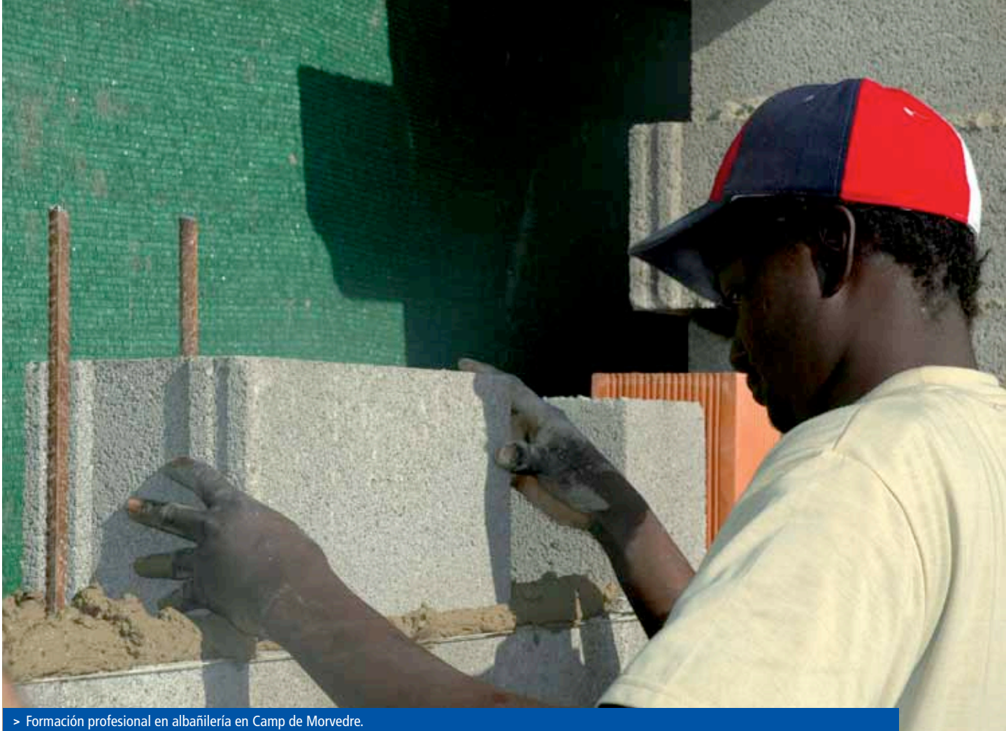
> Formación profesional en albañilería en Camp de Morvedre.