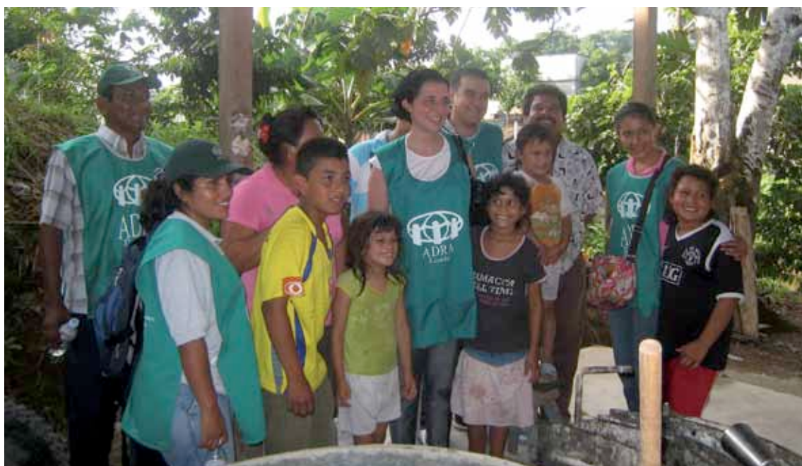
> Directora de ADRA España visita el proyecto de Ecuador.

A DRA España ha tenido que intervenir en varios países como Filipinas, Somalia, El Salvador, Indonesia y Ecuador . Se ha actuado en respuesta a desastres naturales (Filipinas) y a crisis humanitarias complejas (Somalia) y casos de alta vulnerabilidad humana (refugiados colombianos en territorio ecuatoriano). El incremento en el volumen de proyectos, número de países para las respectivas intervenciones, y de la extensión de la coordinación estratégica entre ADRA España y otras oficinas de Europa, África y Asia, nos lleva a la conclusión que la necesidad de una respuesta humanitaria eficaz es cada día más evidente, y confirma el mandato de la organización de servir y contribuir en la labor de salvar vidas y aliviar el sufrimiento.