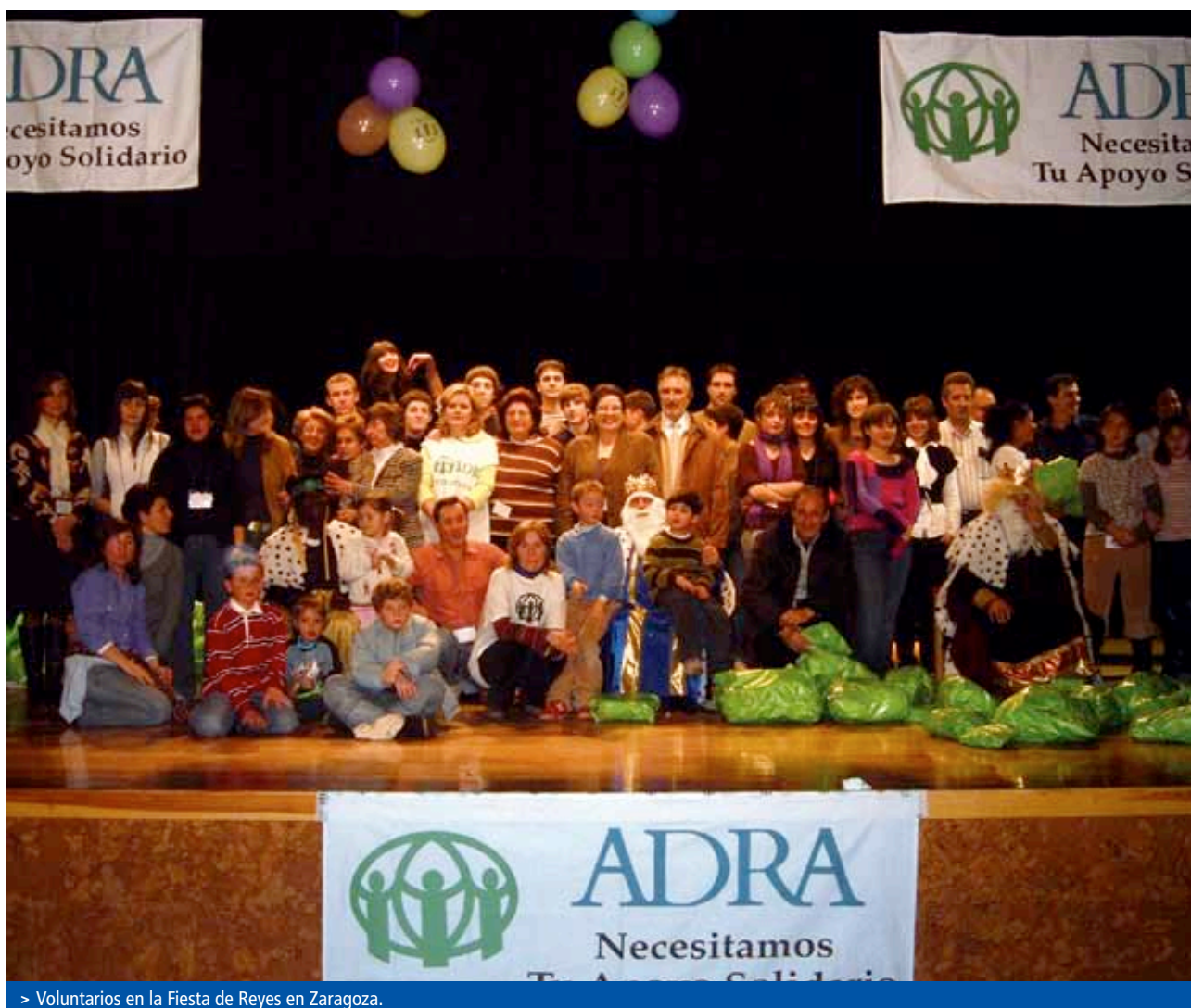
> Voluntarios en la Fiesta de Reyes en Zaragoza.

Colt Telecom, Galería Comercial Utrillas, Alcampo Utrillas, Madrid y Comercial Alí.