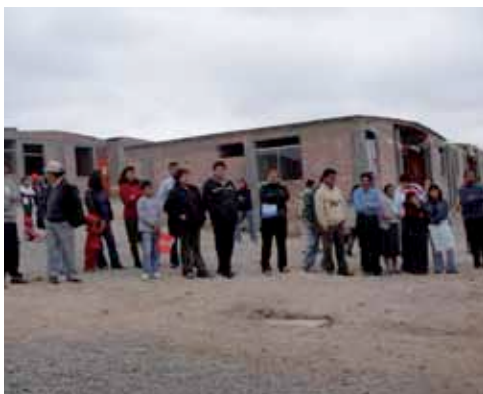
> Casas para los damnificados del terremoto de 2007.

Agencia Española de Cooperación Internacional para el Desarrollo, AECID, ADRA España, ADRA Perú, Gobierno local y beneficiarios.