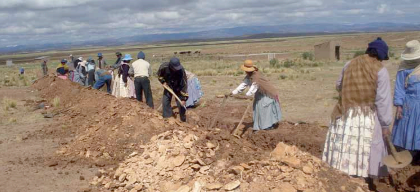
> Excavación y colocación de tuberías para la línea de inducción.