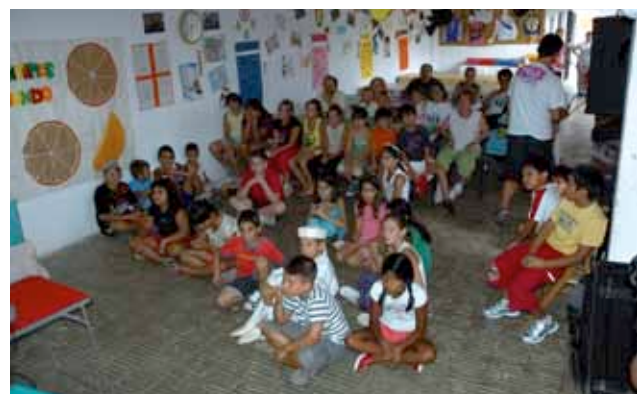
> Niños y niñas del campamento.