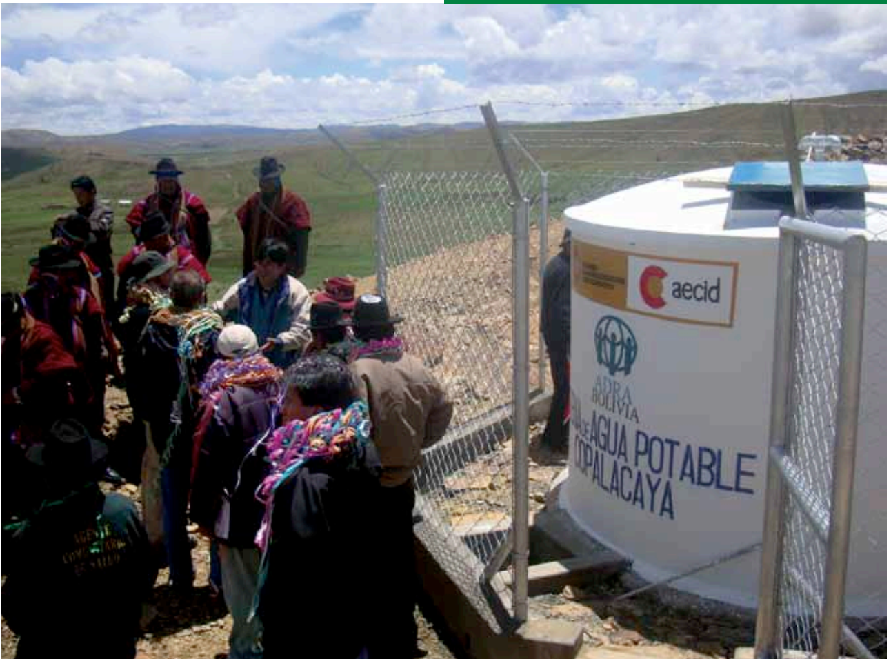
> Tanque de almacenamiento de agua potable en Bolivia.