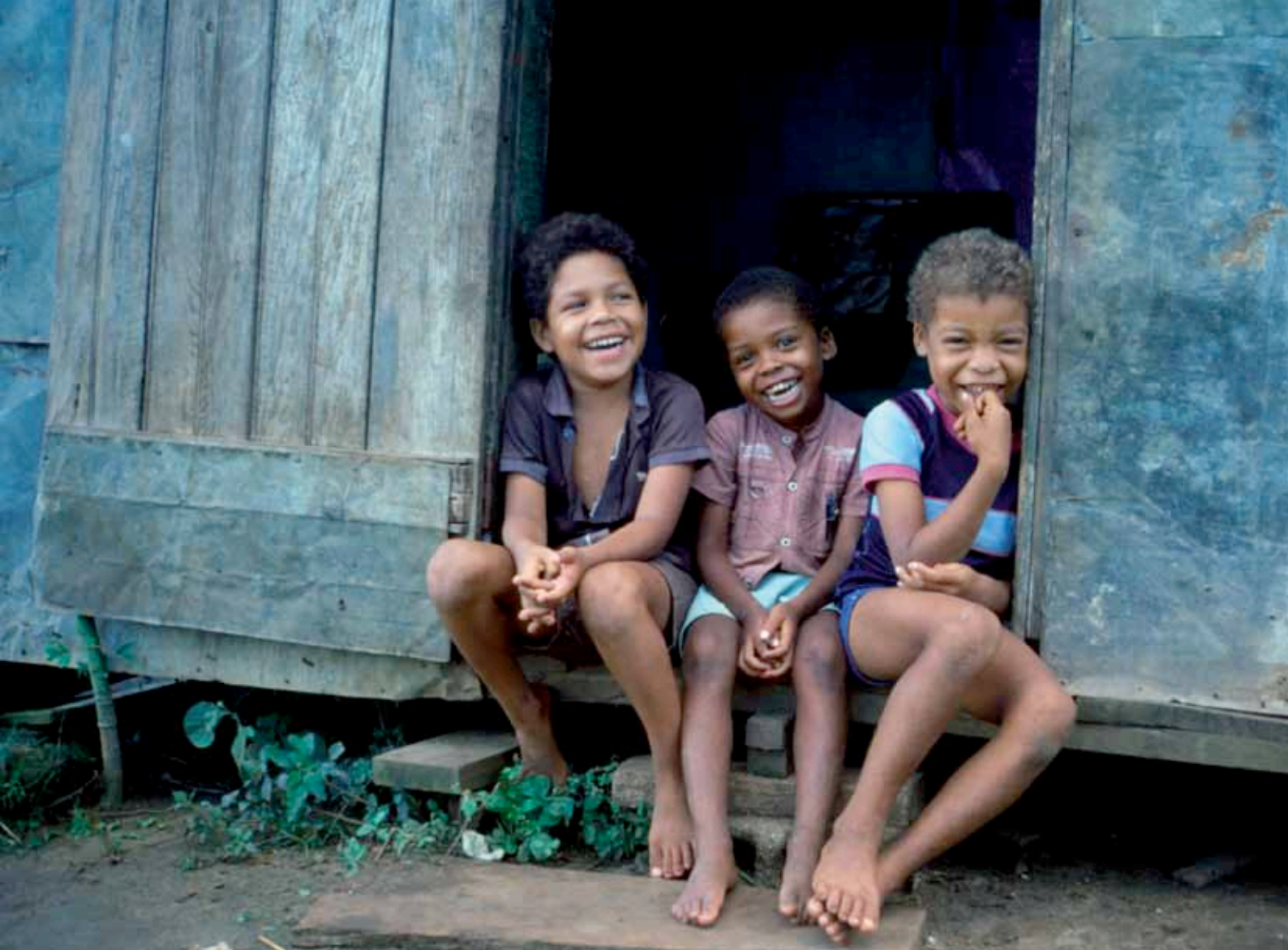
> Niños beneficiarios del proyecto.