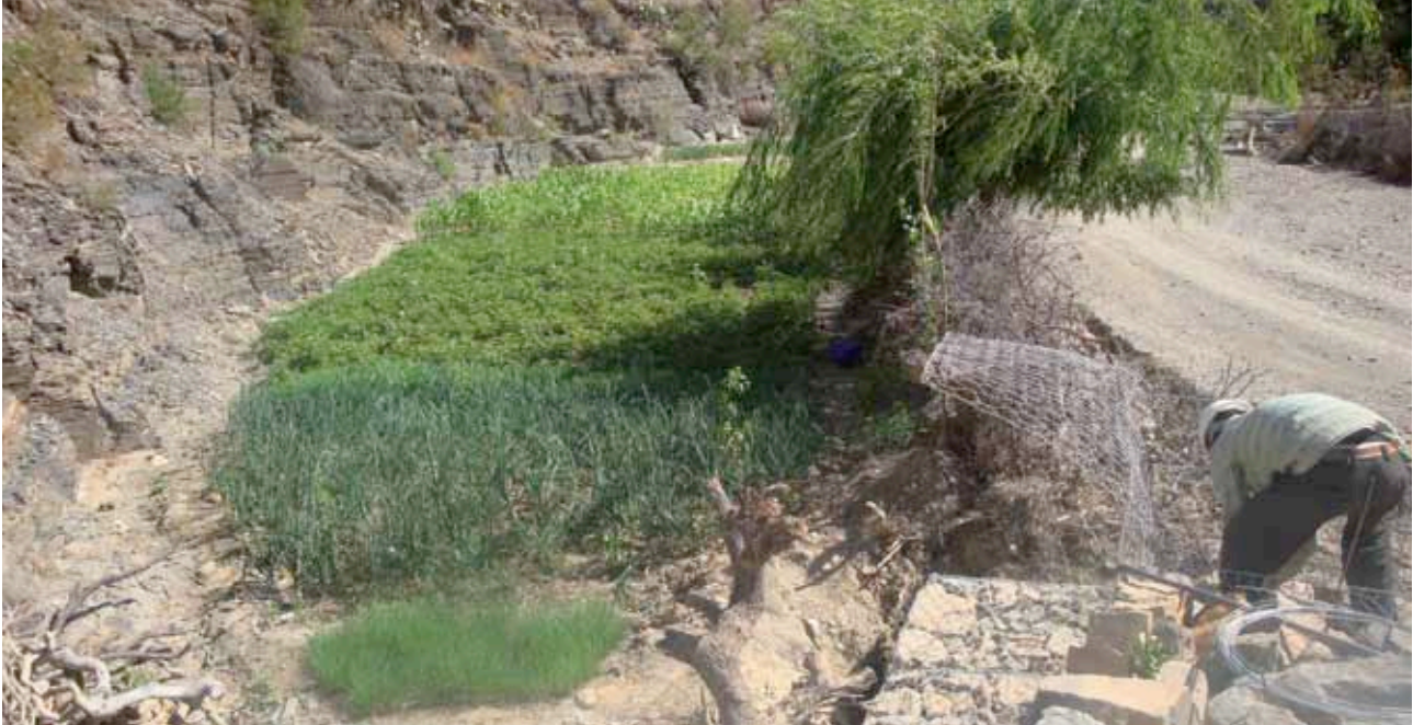
> Sistema de riego.