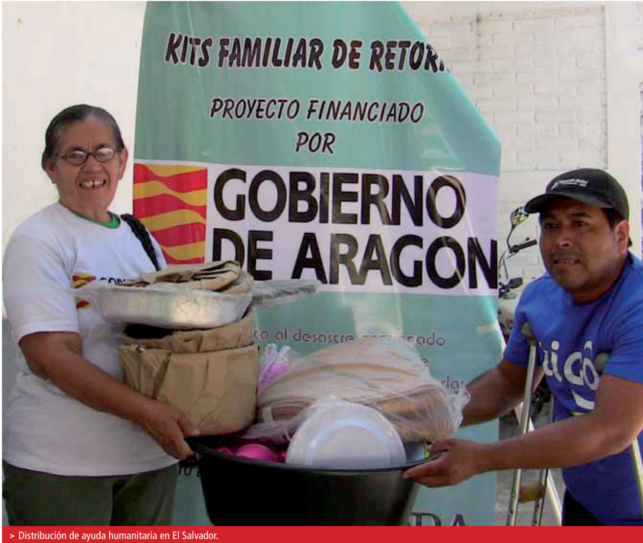
> Distribución de ayuda humanitaria en El Salvador.