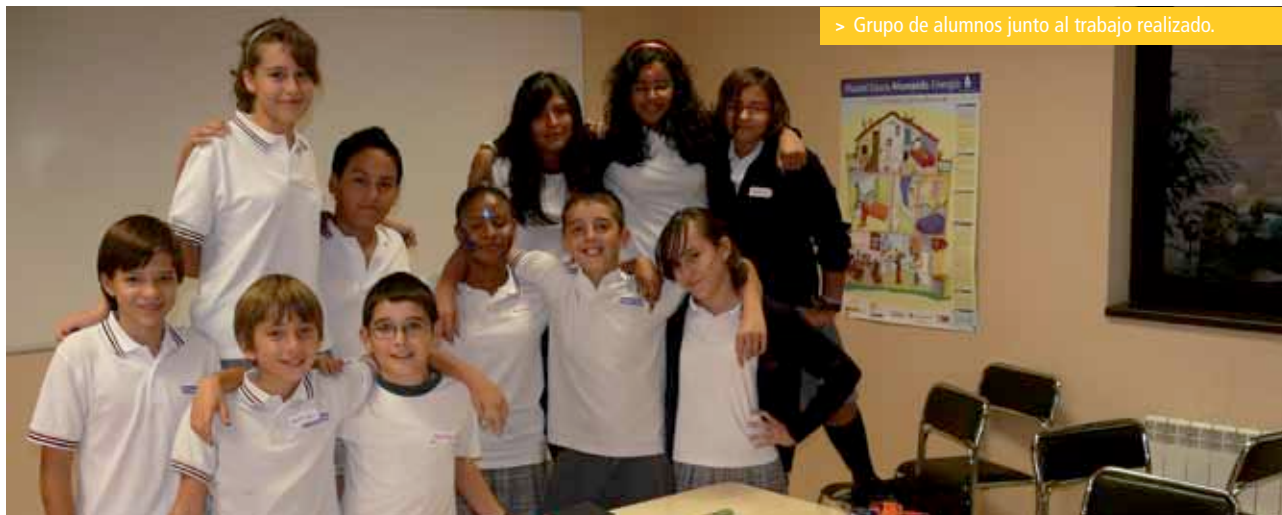
> Grupo de alumnos junto al trabajo realizado.

jornada de trabajo con la colaboración de la Directora del nivel y profesores. Cada uno de los alumnos/as trabajaron sobre los ODM a través de diversas actividades.