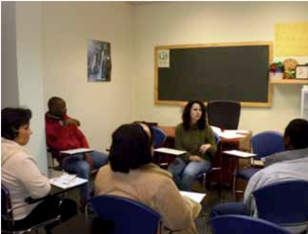
> Taller de empleo en Vitoria.