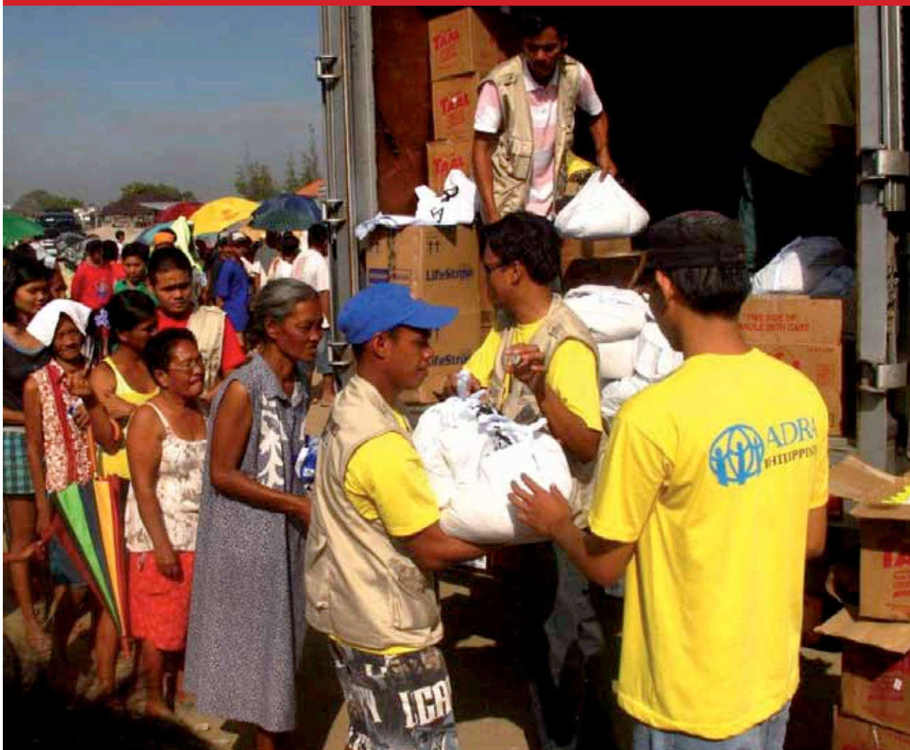
> Distribución de alimentos a familias en Manila.