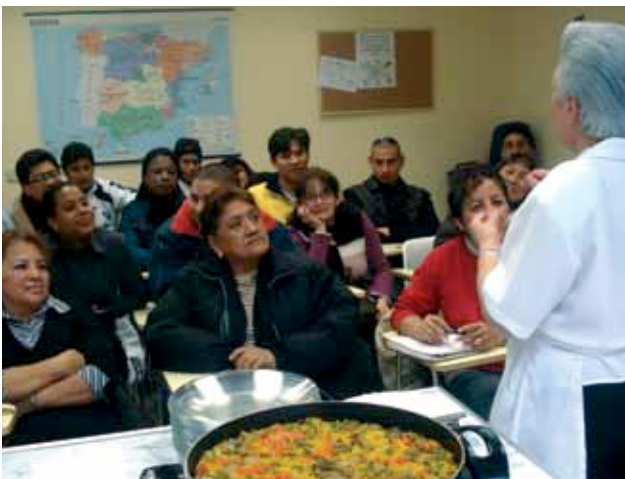
> Curso de cocina española en Madrid.