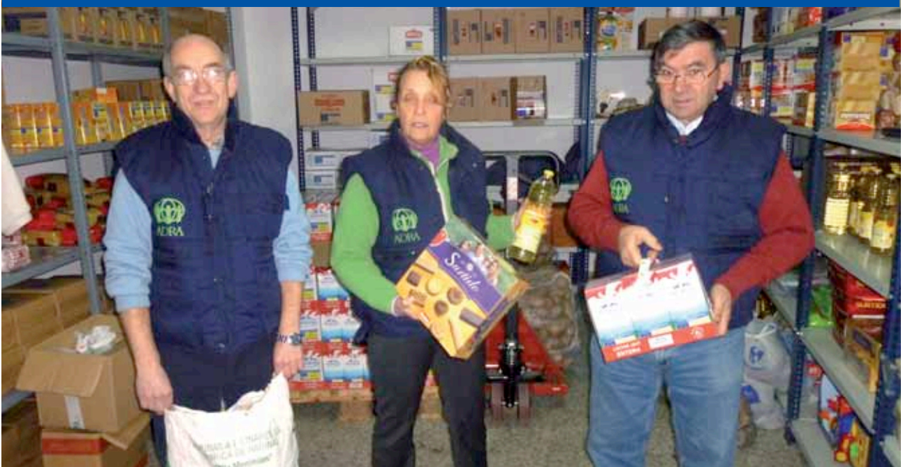
> Voluntarios en almacén de A Coruña.

Ayuntamiento de Algeciras (Cádiz), Ayuntamiento de Sagunto (Valencia), Ayuntamiento de A Coruña, Ayuntamiento de El Puerto de Santa María (Cádiz) y La Caixa.