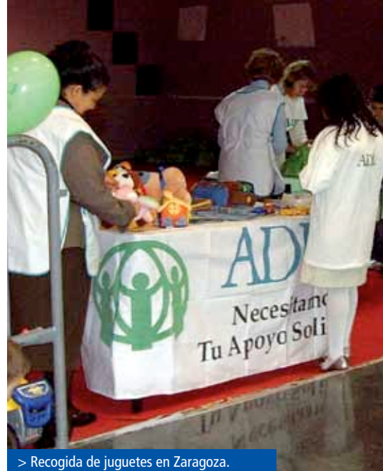
> Recogida de juguetes en Zaragoza.

Los juguetes provienen de donaciones de particulares, de donaciones de empresas jugueteras, de empresas que hacen campañas de recogida entre sus empleados y de recogidas organizadas por Centros comerciales.