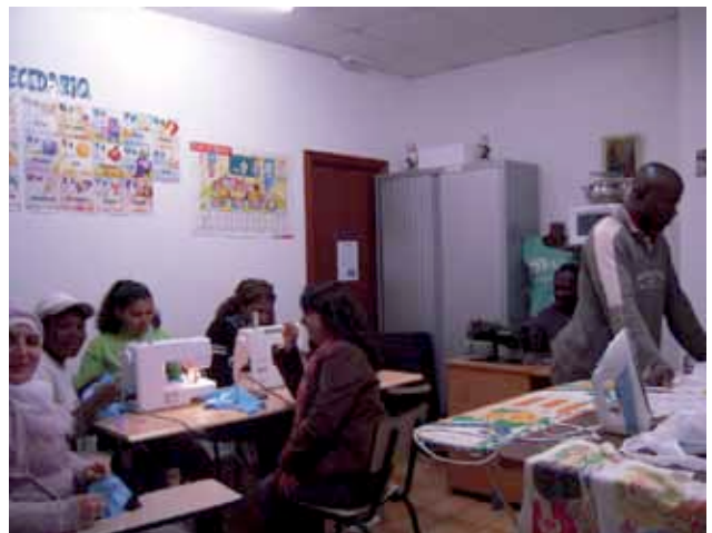
> Arreglos textiles en Zaragoza.