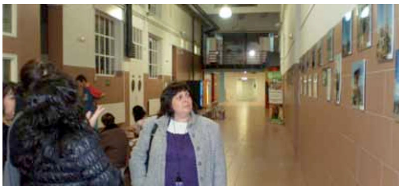
> Exposición fotográfica realizada en el Centro Cívico Iparralde – Vitoria.

Un total de 20.000 personas han visitado estas exposiciones.